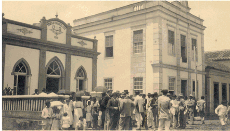
1º Templo da IPM na cidade de Manhuaçu / Ao lado antiga Casa Pastoral - 1913