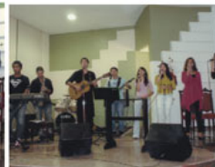
Ministério de Louvor da IPCI