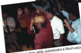
Pastores intercedem pelas autoridades e Manhuaçu