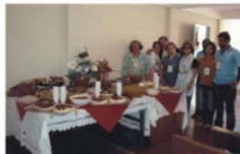
Mesa de doces e colaboradores