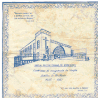
Lencinho de pano distribuído como lembrança em 1980