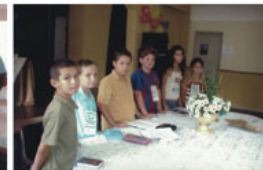
Diretoria Federação de Crianças