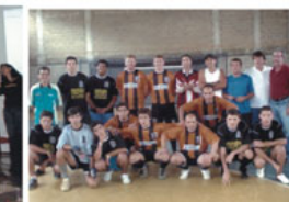
Atletas da IPM e IPCI