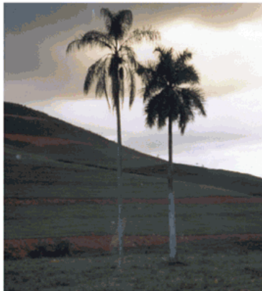
Local da Construção do 1º Templo da IPM na Barra do Jequitibá, construído entre as Palmeiras Centenárias.