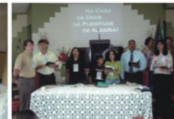
Mesa diretora do Congresso