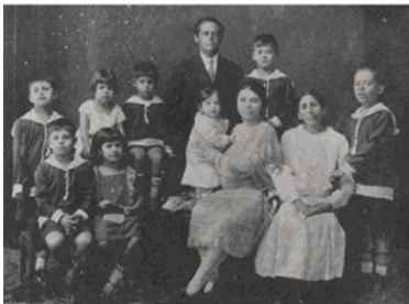
Família Siqueira quando chegou a Alto Jequitibá - 1929