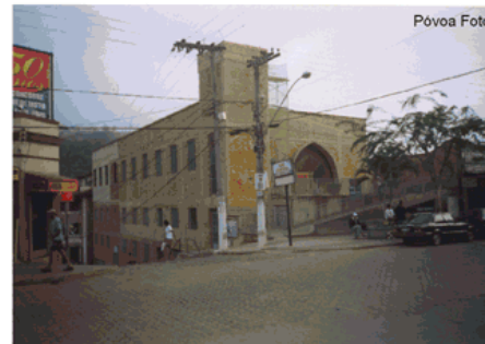
Templo em reforma 2004/2005