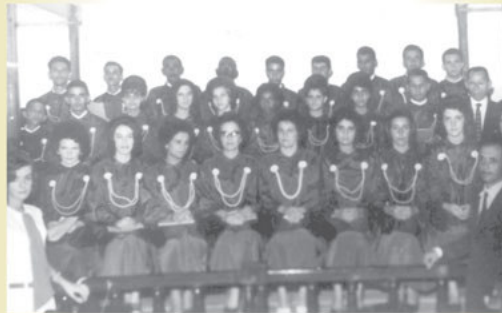
Coral IPM 25/12/62