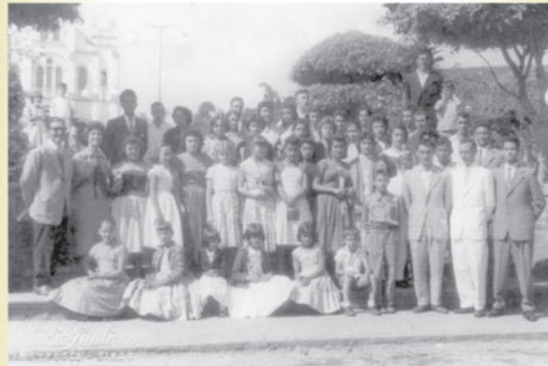
Escola Dominical IPM Julho de 1962